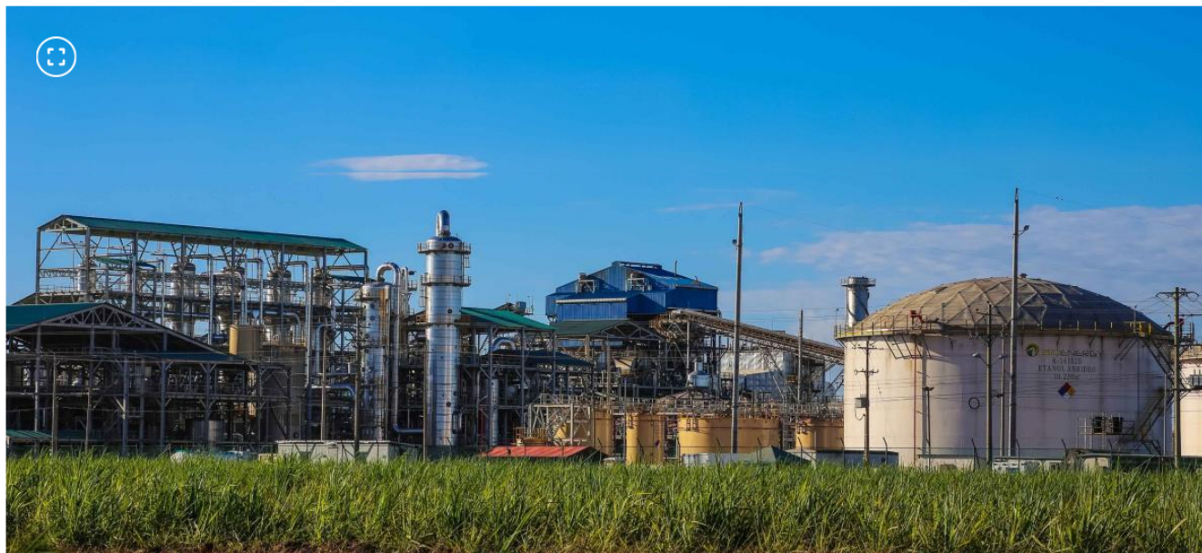
Bioenergy, antigua filial de Ecopetrol , fue sancionada por la Contraloría por 1 billón de pesos

Es el fallo con responsabilidad fiscal de mayor cuantía emitido por el ente de control en 2024.