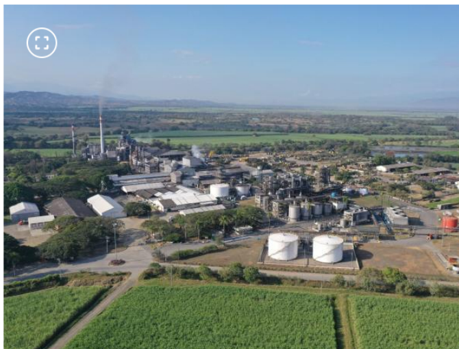
Producción de Etanol.

productividad. Esta pérdida obligó a la erradicación de las variedades de estos cultivos y la disposición de la materia prima como abono verde y no para producir etanol, que era el fin último de la asignación salarial.