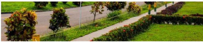
Planta de Bioenergy, en Puerto Gaitán, Meta

Bioenergy S.A.S. se acabó y fue reemplazada por Agrícola de Los Llanos, que acogió a los cerca de 750 trabajadores que se tienen en Puerto López y Puerto Gaitán , en el Meta. Entretanto, Bioenergy Zona Franca -que tiene la planta industrial- entró a un proceso de reorganización que tardará cuatro años más.