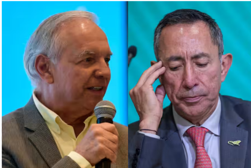
Ricardo Bonilla, ministro de Hacienda, y Ricardo Roa, presidente de Ecopetrol .