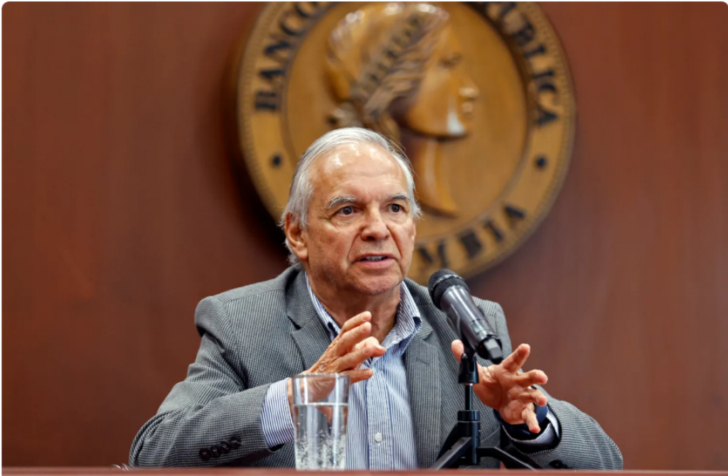
El ministro de Hacienda de Colombia, Ricardo Bonilla, en una fotografía de archivo.