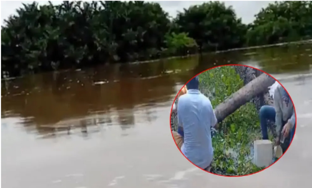
Contaminación en ciénaga San Silvestre.

La empresa Cenit, filial de Ecopetrol , descartó daños a los ductos que transportan hidrocarburos en inmediaciones de la ciénaga San Silvestre en Barrancabermeja.