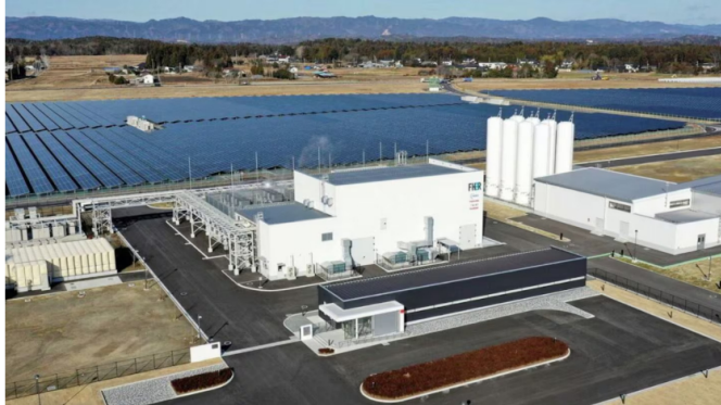
Archivo - Planta de hidrógeno verde (Imagen de referencia) IBERDROLA - Archivo (Sebastián Carrasco/Europa Press)

Con una inversión aproximada de 28,5 millones de dólares, tendrá una capacidad de producción de 800 toneladas anuales