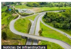
Noticias De Infraestructura

Estas son las megavías en Colombia que se volverían a entregar en concesión