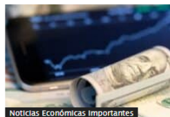
Noticias Económicas Importantes

Estas son las megavías en Colombia que se volverían a entregar en concesión