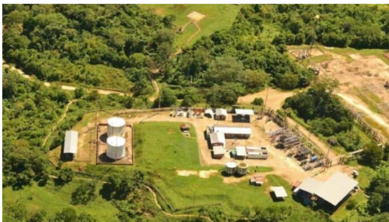
Ecopetrol anunció que su planta de gas Gibraltar ya reinició operaciones.

Luego de que el domingo, 24 de noviembre de 2024, la petrolera estatal colombiana, Ecopetrol , informara sobre la suspensión de la operación en su planta de gas Gibraltar debido a una toma por parte de miembros del Movimiento Político de Masas Social y Popular del Centro Oriente de Colombia (Mpmcpcoc)-, se confirmó el reinicio de sus operaciones.