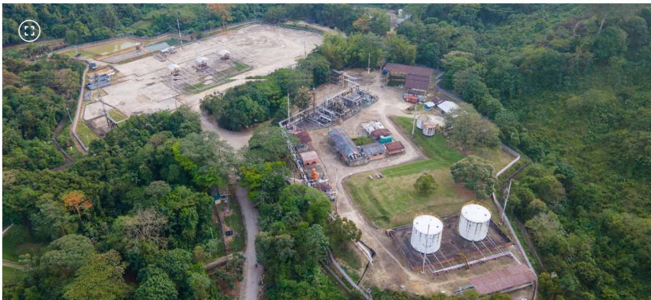
Planta de Gibraltar

Esta planta produce 38 millones pies cúbicos por día de gas natural para Norte de Santander, Santander y parte de Antioquia.