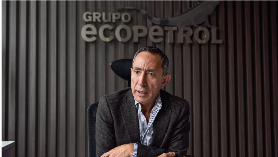
La junta de Ecopetrol dio un nuevo anuncio para 2025.

Ecopetrol es una de las empresas más grandes de Colombia y una de las principales compañías petroleras de América Latina. Desde hace varias décadas, opera en toda la cadena de valor del petróleo, que incluye exploración, producción, refinación, transporte y comercialización de hidrocarburos.