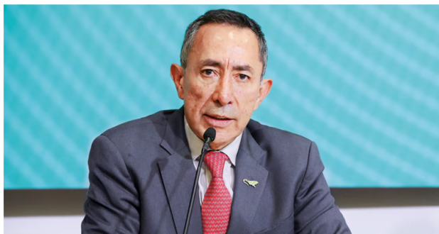
Ricardo Roa, presidente de Ecopetrol.