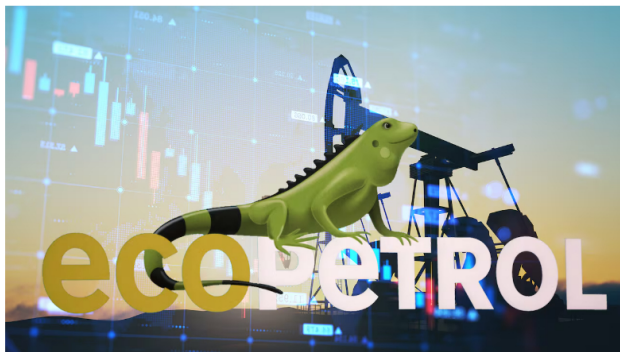
acciones Ecopetrol

Con esta decisión, la petrolera apalancará la reducción adicional de unas 300.000 toneladas de emisiones de CO 2 equivalente al 2025, lo que los impulsaría a cumplir la meta de reducción de emisiones para 2030.