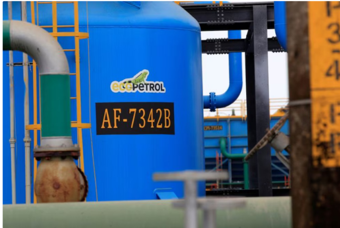
Análisis sobre afectaciones pensionales por desplome de acciones de Ecopetrol