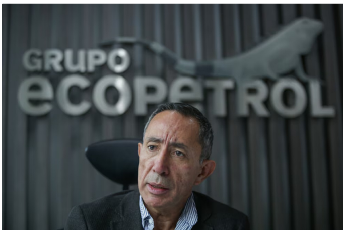
Ricardo Roa ha sido cuestionado por su administración

La desvalorización de Ecopetrol impacta directamente en los fondos privados de pensiones, que concentran el 36% del 11,5% de las acciones privadas en circulación de la petrolera. Este porcentaje representa inversiones vinculadas a los ahorros de 18 millones de afiliados al régimen privado de pensiones. Estas inversiones están distribuidas en diversos portafolios, como los de riesgo moderado, alto, conservador, retiro programado y cesantías, todos afectados por el desempeño de las acciones de Ecopetrol.