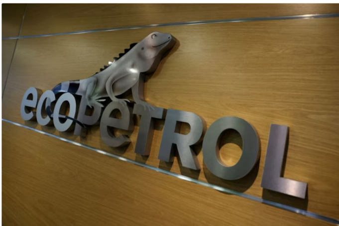
Así van los rendimientos de Ecopetrol en 2024 - crédito Luisa González/Reuters

Las consecuencias de esta situación afectan directamente a los fondos de pensiones y cesantías de los trabajadores colombianos, que tienen inversiones significativas en Ecopetrol. Actualmente, la Nación posee el 88,49% de la compañía, mientras que fondos privados de pensiones como Porvenir, Protección, Colfondos, Skandia y Seguros Bolívar también participan con porcentajes menores, siendo Porvenir el mayor inversor privado con el 1,74% de las acciones.