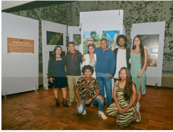
Desde 2021, con el apoyo del Fondo Europeo para la Paz de la Unión Europea, el Colectivo Miradas ha desarrollado talleres y rutas de formación en producción audiovisual en zonas históricamente afectadas por el conflicto armado. Estas actividades han impactado a más de 500 personas

En conmemoración de los 8 años de la firma del Acuerdo de Paz, junto a representantes de la Agencia para la Reincorporación y la Normalización, ARN, cuatro integrantes del Colectivo Miradas, incluidos tres firmantes de paz, realizarán, una gira del 3 al 12 de diciembre por países como Bélgica y España.