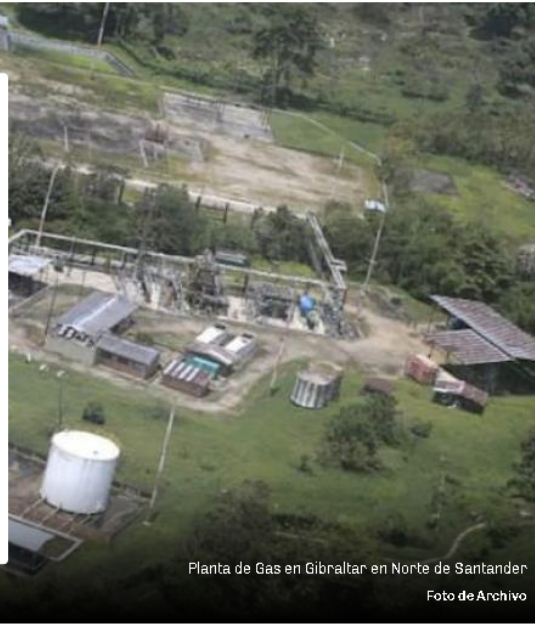
Planta de Gas en Gibraltar en Norte de Santander