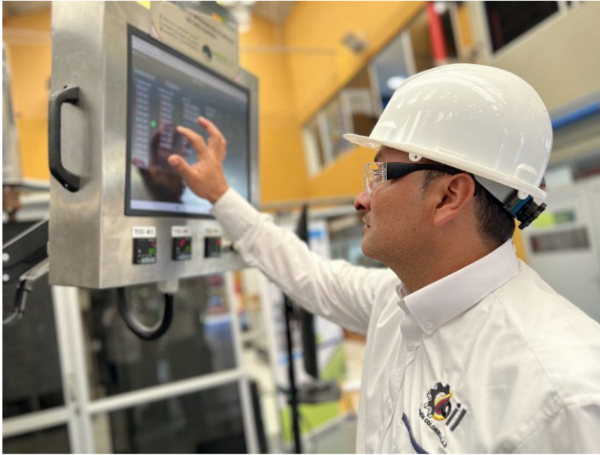
El Icpet ubicado en Piedecuesta, Santander, tendrá un rol protagónico en esta nueva apuesta.

Para el segundo semestre de 2025 se tiene prevista la apertura de este centro, que tendrá una sala de reuniones, una zona de coworking y oficinas donde los innovadores podrán llevar sus propuestas tecnológicas a otro nivel.