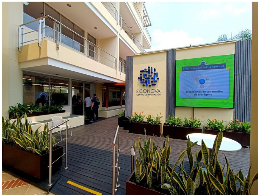
Los centros Econova han beneficiado a más de 1.000 empresas e impulsado 50 proyectos de protección ambiental, descarbonización y energías limpias.