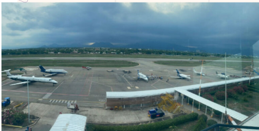
Ecopetrol garantiza al país el suministro de combustible para aviación

El Gobierno Nacional, en coordinación con Ecopetrol y los Ministerios de Transporte y Minas y Energía, informó que se logró superar el eventual riesgo de desabastecimiento de combustible JET A1 para el transporte aéreo. Esta amenaza, anunciada por comercializadores y mayoristas, fue contrarrestada gracias a una serie de acciones concretas y coordinadas por las tres entidades, quienes presentaron un informe detallado de las medidas implementadas.