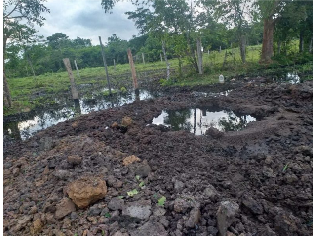
Santander si podría verse afectado por desabastecimiento de gas.