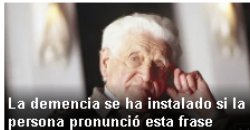
La demencia se ha instalado si la persona pronunció esta frase