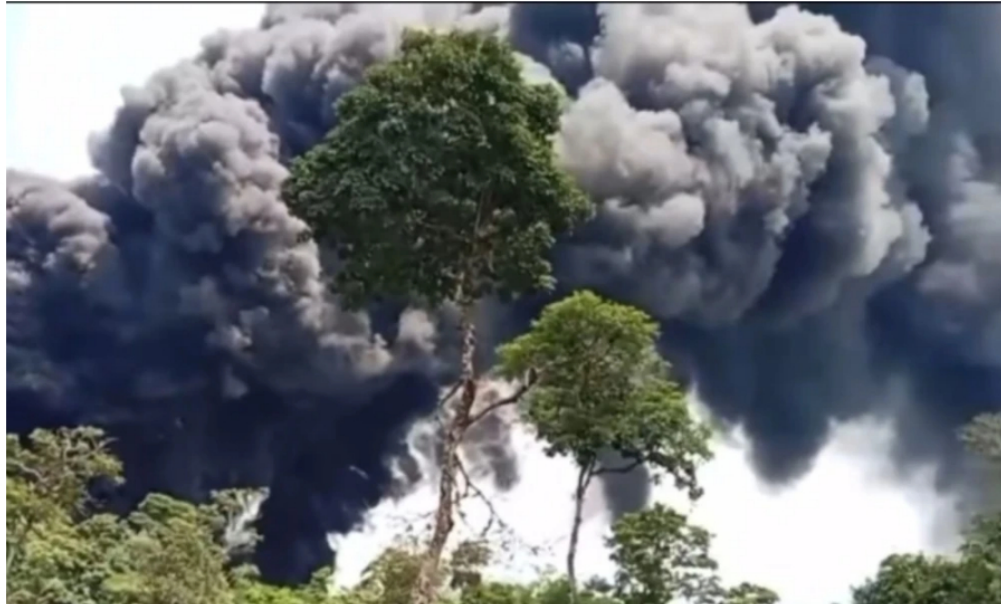
Atentado en Arauca

Ecopetrol advirtió sobre el posible desabastecimiento de gas tras serios problemas de orden público en Arauca.