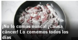
¡No lo comas nunca! ¡Causa cáncer! Lo comemos todos los días