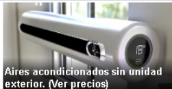
Aires acondicionados sin unidad exterior. (Ver precios)