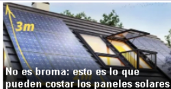
No es broma: esto es lo que pueden costar los paneles solares