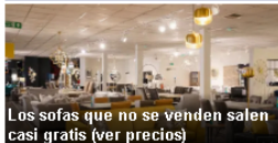
Los sofás que no se venden salen casi gratis (ver precios)