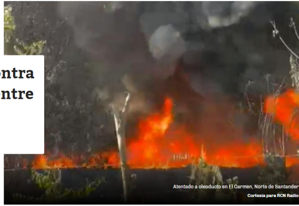
Atentado a oleoducto en El Carmen, Norte de Santander