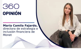
OPINIÓN Empresas La IA puede ayudar a reducir la brecha de género en la inclusión financiera