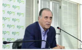
Noticias de Antioquia Hidroituango: EPM anuncia taponamiento del túnel derecho para septiembre de 2024