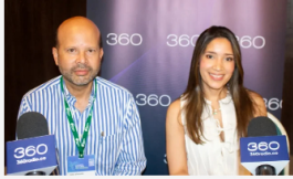
Entrevistas ¿Qué tanto le beneficia a Colombia el Acuerdo de Escazú?