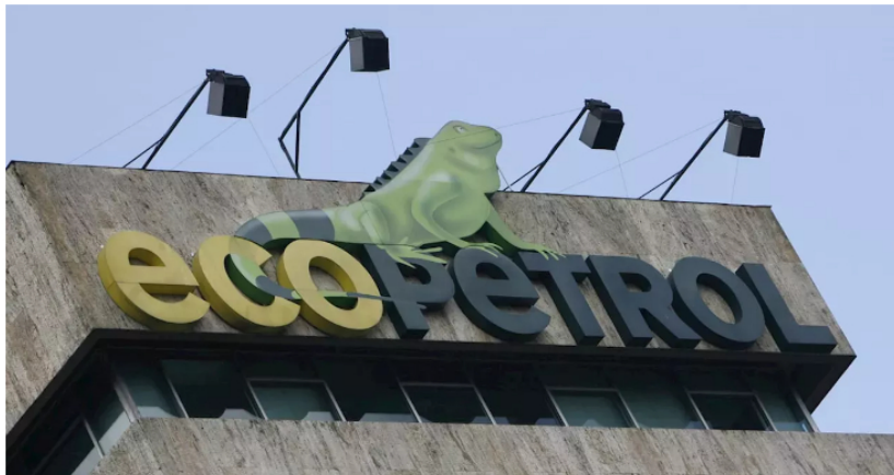
Petroleo, Junta Directiva De Ecopetrol , Gustavo Petro

Los exmiembros presentaron su carta de renuncia en protesta a las decisiones del mandatario