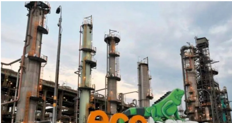
Colombia Últimas Noticias, Colombia Titulares

Tras la renuncia, los accionistas expresaron que las finanzas de la empresa se “deteriorarán”, a modo de advertencia.