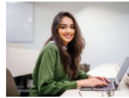
Global MBA 100% en línea