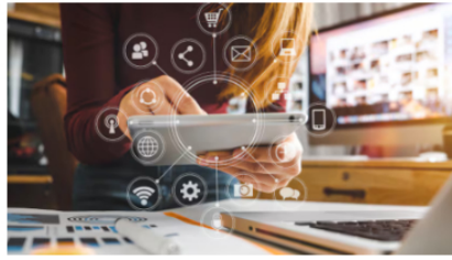
Maestría a distancia en Ecommerce