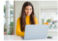
Maestría en línea en Marketing Digital