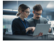
Maestría en Administración de Empresas con Concentración en Marketing Digital