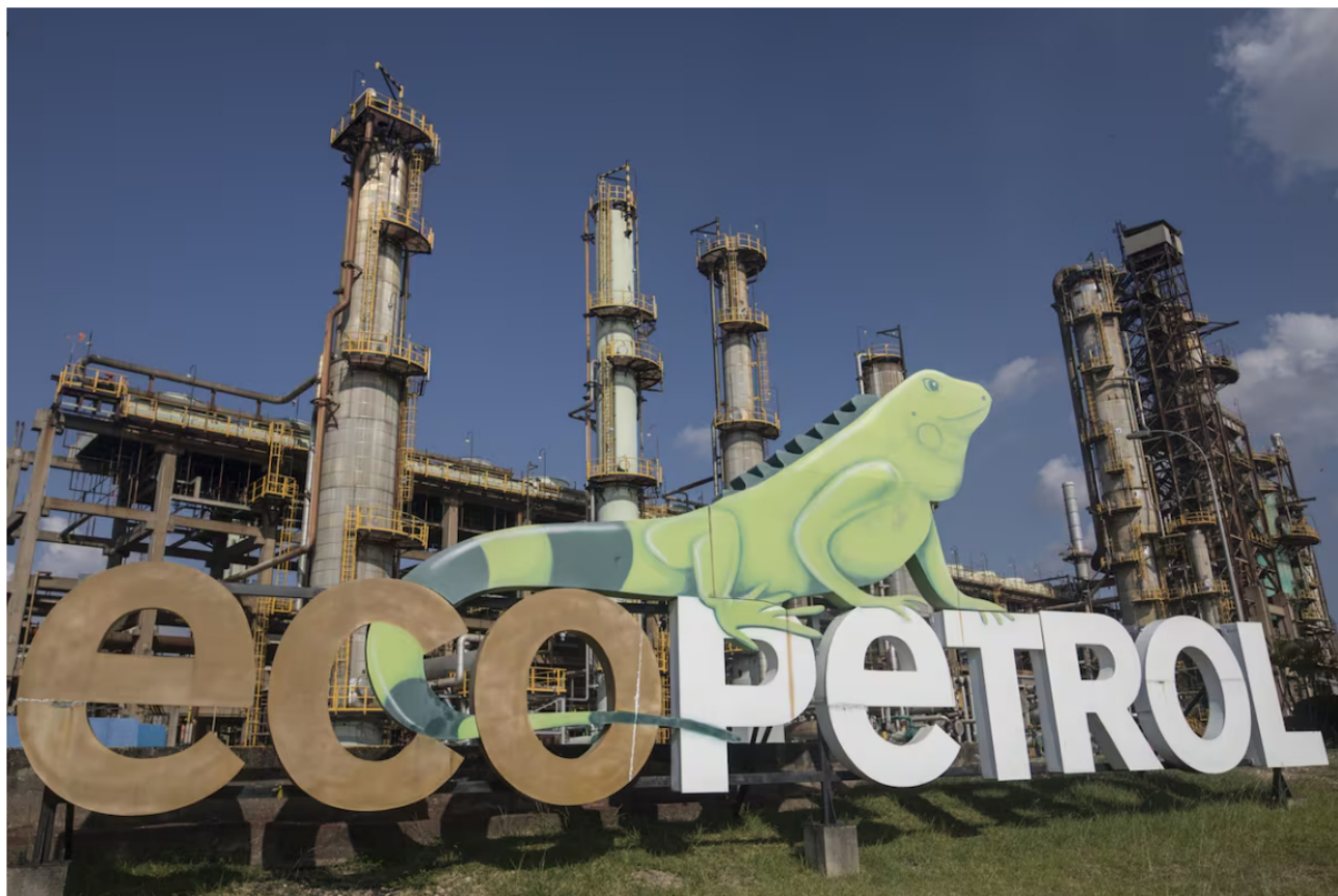
Una refinería de Ecopetrol en Barrancabermeja (Colombia), el 15 de febrero de 2022.