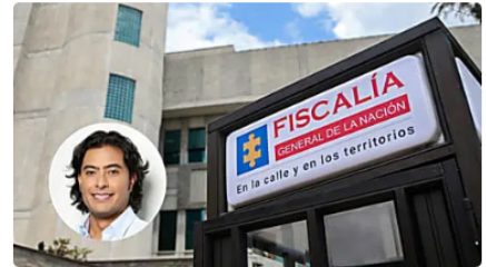
Caso Nicolás Petro: Fiscalía anunció que luego de la sal El Heraldo