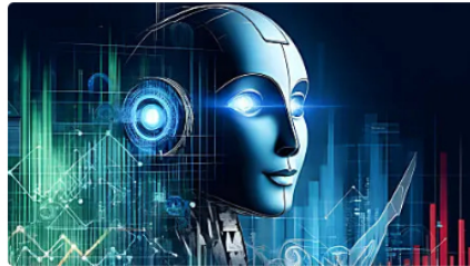
Aprende a invertir con inteligencia artificial como un profesional TEUG | Patrocinado