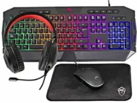
Combo Kalley Alámbrico Teclado + Mouse + Audifonos + Padmouse Gaming Negro ¡Kalley Te Trae Lo Que Estabas Buscando! El Combo Gamer K-kgc Que Incluye Teclado + Mouse + Audifonos + Pad. ... Alkosto | Patrocinado