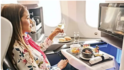
Con Air Europa, vuela en Clase Business desde 1970USD* Air Europa | Patrocinado