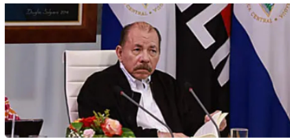
Daniel Ortega, presidente de Nicaragua, rompió relaciones