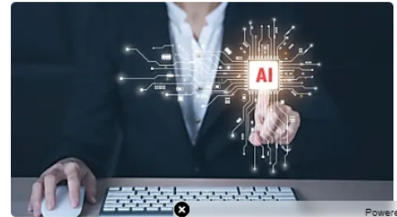
Bogotá: Su IA trabaja cómo] justfinancefnd | Patrocinado