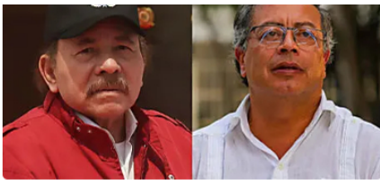
Petro arremete contra Daniel Ortega tras llamarlo "arrast" El Heraldo