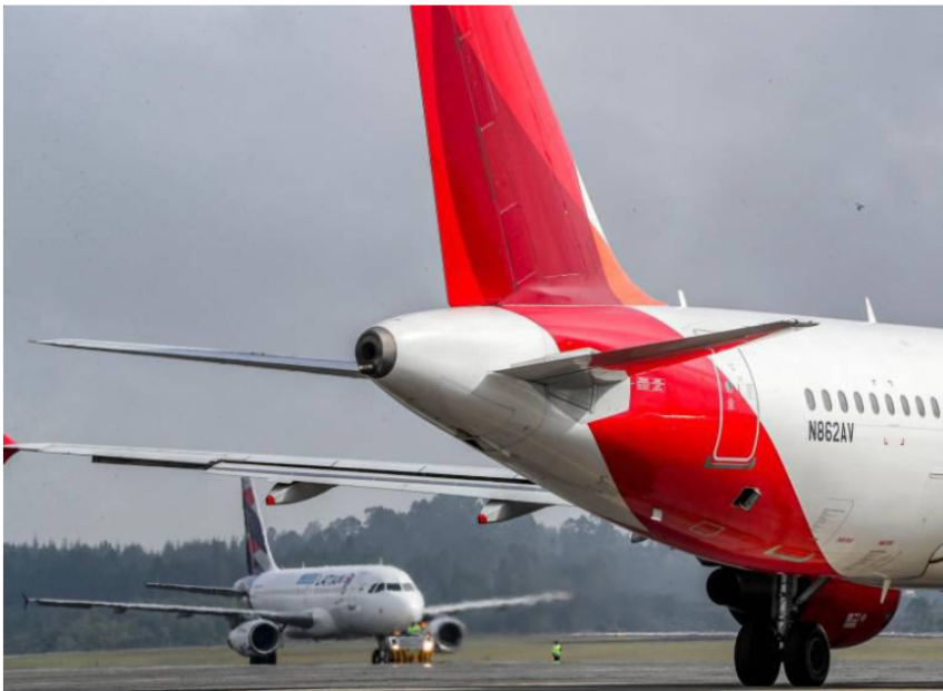
Según Ecopetrol, la respuesta a esta contingencia fue inmediata.

combustible para aviones; Ecopetrol y el Gobierno colombiano dijeron que la situación ha sido controlada.