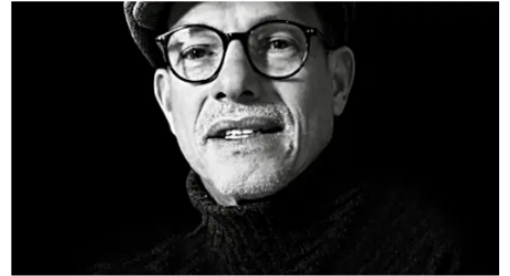
Repasando a Petro Cambio Colombia