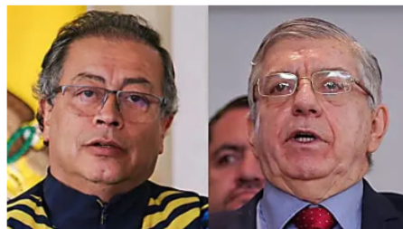
Excmo. Gaviria arremete contra Gobierno de Petro por desacato a la Corte Cambio Colombia