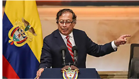
¿Por qué Gustavo Petro cambió su enfoque hacia la confrontación? Cambio Colombia