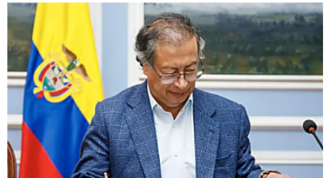
¿Fue "sensata" la reacción de Gustavo Petro sobre las elecciones en Venezuela? Cambio Colombia