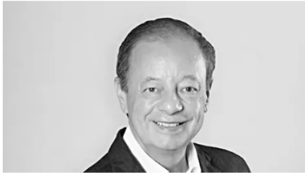
Forever Petro Cambio Colombia