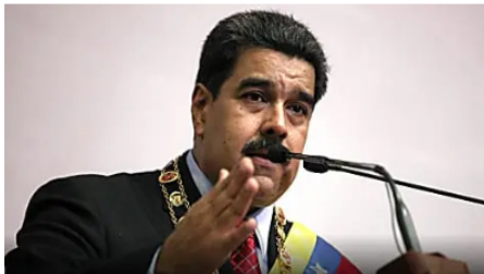
Nicolás Maduro responde a recomendaciones de Gustavo Petro sobre Venezuela Cambio Colombia