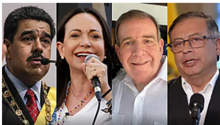
Gustavo Petro revela dudas sobre proceso electoral en Venezuela Cambio Colombia