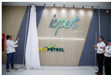
El presidente Gustavo Petro reveló el logo del Instituto Colombiano del Petróleo y las Energías de la Transición, Icpet, ubicado en Piedecuesta.