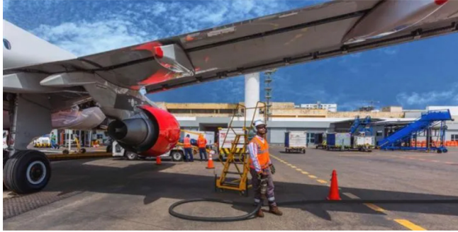
Un operador de Terpel aprovisiona combustible a un avión en Colombia.

Terpel asegura que en junio, julio y lo corrido de agosto han recibido un 26,3% menos de la cantidad de combustible JET A1 que había solicitado a Ecopetrol.