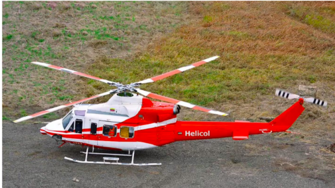
Licitación de helicópteros de Ecopetrol: Helicol responde y se defiende ante las acusaciones

Ante la polémica alrededor de la empresa de helicópteros, esta respondió enérgicamente hacia las acusaciones