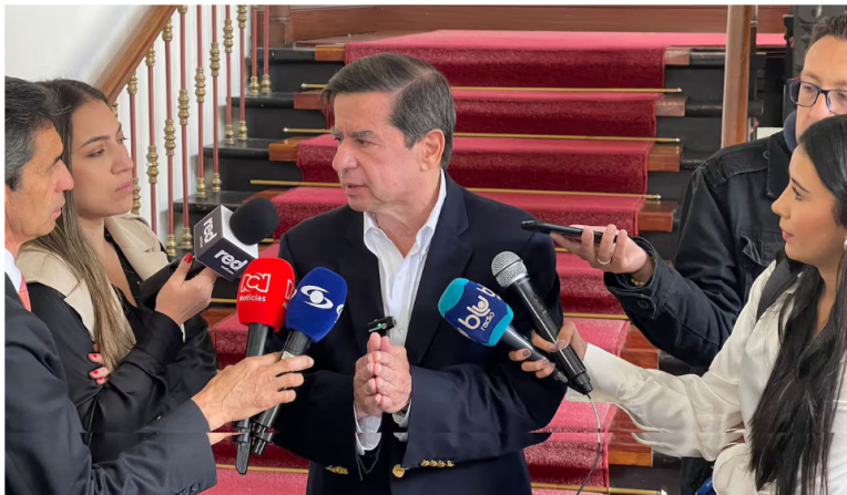
Ministero del Interior, Juan Fernando Cristo.

27 de agosto de 2024 Por: Redacción El País