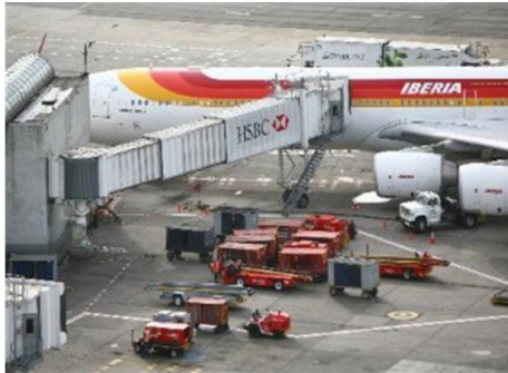
La Aerocivil asegura que la operación aérea de El Dorado no se verá afectada por la reducción de suministro de combustible jet A1.

"La situación de déficit de combustible para aviación es estructural, tal y como lo ha evidenciado esta coyuntura. Esto se explica, entre otros factores, por el incremento en el tráfico aéreo y la limitada capacidad de refinación que hoy tiene el país ", argumentó la compañía.