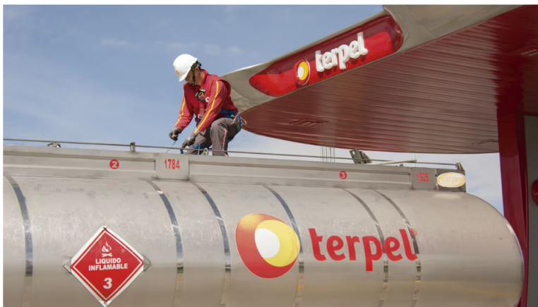
Terpel es el principal distribuidor de este tipo de combustible.

27 de agosto de 2024 Por: Redacción El País