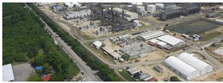
La refinería de Cartagena es la encargada de refinar gran parte del combustible para aviones y tuvo una falla en 35 de sus máquinas.

De esta manera, la empresa distribuidora, que fue blanco de insinuaciones por parte del Presidente Petro, sobre posible especulación en el manejo del combustible, le respondió que el problema es "estructural", debido también a la alta demanda de usuarios que cada día crece.