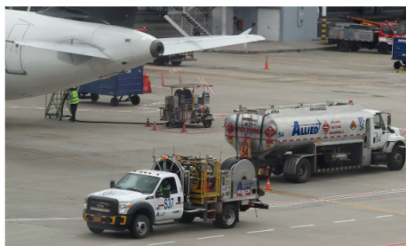
Las aerolíneas tienen su operación con normalidad.

"Terpel informó de manera oportuna, transparente y directa a sus clientes del sector aeronáutico sobre la disminución en las entregas y sugirió la racionalización en los consumos a través de varias comunicaciones enviadas entre el 16 y el 21 de agosto ", detalló Terpel.