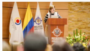
Entes de control alertan sobre serios rezagos en la implementación de Ley de Víctimas