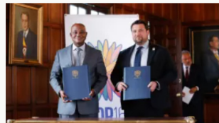
Colombia y Naciones Unidas firman acuerdo para garantizar plan de seguridad en la COP16