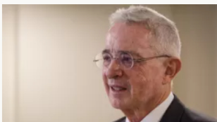
Fechas de las audiencias preparatorias de juicio contra el expresidente Álvaro Uribe