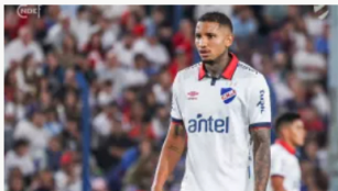
Luto en el fútbol: falleció Juan Izquierdo, jugador de Nacional de Uruguay