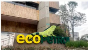
Ecopetrol se pronuncia frente a señalamientos de Terpel