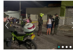
JUDICIAL Otro crimen en Bucaramanga: Dos hombres asesinaron a cuchillo a alias 'Tatico'