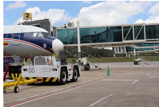
Este resultado se atribuye a la apertura de nuevos vuelos a Bogotá y Cartagena por parte de Wingo y Clic, así como al aumento de frecuencias por parte de Avianca y Latam.

“Lo que hemos revisado el fin de semana y durante tres reuniones, fue claro que hoy el país está garantizando la producción del combustible. Lo que estamos afrontando es una verificación de la logística. Como están los inventarios de los aeropuertos. Anoche se nos informaba que una de las comercializadoras ha manifestado tener una restricción para la entrega del producto ”, afirmó la ministra de Transporte, María Constanza García.