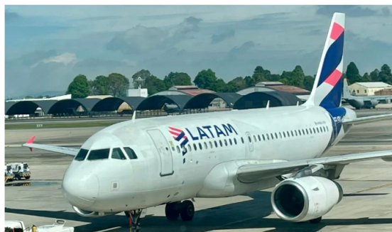
Latam reportó afectaciones por la falta de combustible.

Esto último, vale tener en cuenta, luego de anunciar la recuperación de la producción y la estabilidad de las 35 unidades operativas de la Refinería de Cartagena.