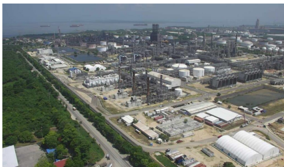
Refinería de Cartagena.

Datos de la compañía dan cuenta de que La Refinería de Cartagena, en condiciones normales de operación, produce en promedio: 99.000 barriles por día de diésel, 38.000 barriles diarios de gasolina regular y extra.