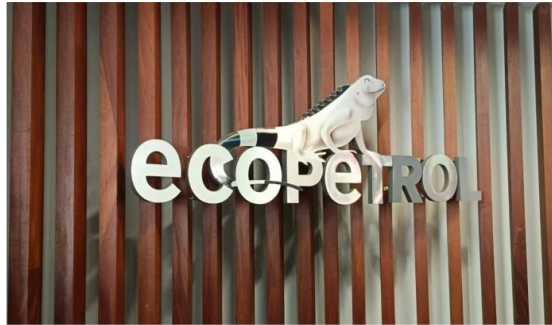
Ecopetrol tuvo un decrecimiento en sus ganancias en el primer semestre de 2024.

En medio de la emergencia que afectó las operaciones en cuatro aeropuertos del país, Ecopetrol dio a conocer que garantizará combustible para aviones en Colombia.