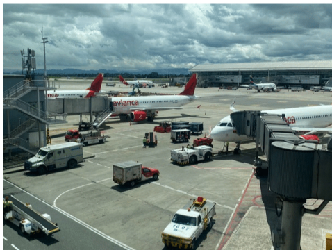
Problemas en la distribución de combustible para aviones generan preocupación a nivel nacional.

Aerolíneas en Bogotá, Medellín, Barranquilla y Cali enfrentan escasez de combustible, pese a que Ecopetrol señala que si hay abastecimiento.