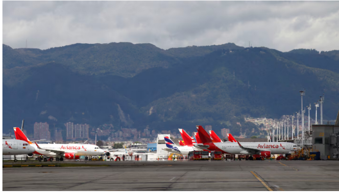
Imagen referencial Santiago, 11 de agosto de 2022. Imágenes de la ciudad de Bogotá, Colombia

¿A quién creer? Algunas aerolíneas han tomado la decisión de cancelar vuelos por escasez; sin embargo el gobierno desmiente esta posibilidad