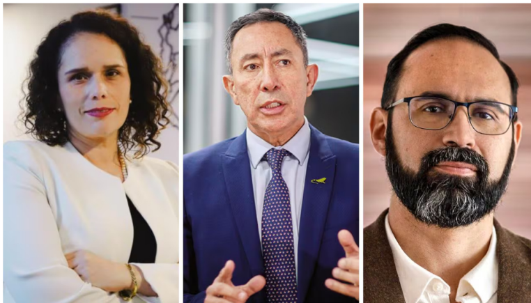
Ministro de Minas y Energía, Andrés Camacho; la ministra de Transporte, María Constanza García; el presidente de Ecopetrol, Ricardo Roa

26 de agosto de 2024 Por: Redacción El País