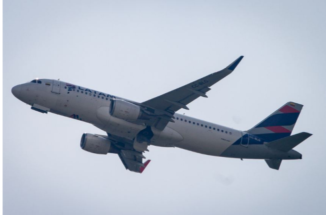
Latam advierte niveles críticos del combustibles para aviones

Latam Colombia informó que tiene bajos los inverios de combustibles para las aeronaves en diferentes aeropuerto del país.