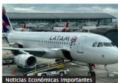
Noticias Económicas Importantes Latam cancela 36 vuelos para el martes; MinTransporte ordena investigaciones contra empresas