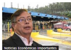
Noticias Económicas Importantes Decisión de Petro de congelar los peajes le costaría a Colombia más de $1 billón