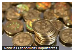
Noticias Económicas Importantes Bitcoin se acerca a los US$65.000 tras declaraciones de la FED y subida del yen japonés