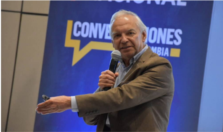
Ricardo Bonilla, ministro de Hacienda de Colombia, confirmó la información de Ecopetrol y la hidroeléctrica de Urrá.

"Ecopetrol" está interesado en comprar Urrá, pero no la puede comprar directamente porque la Ley 142 le impide comprar generadoras de energía, porque ya es propietario de ISA, que es transmisora", dijo el funcionario.