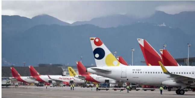
Aviones en el aeropuerto El Dorado de Bogotá.

La Asociación de Transporte Aéreo Internacional (IATA) confirmó la crisis de desabastecimiento y hace un llamado al Ministerio de Minas y Energía para agilizar las medidas ante la contingencia.