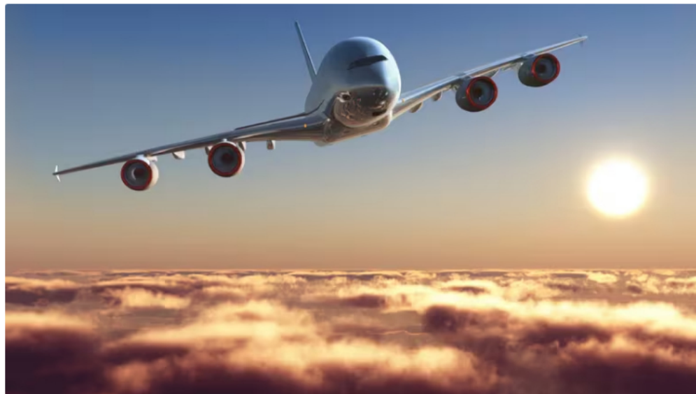
La Asociación de Transporte Aéreo Internacional (Iata) advirtió sobre una posible escasez de combustible de aviación en Colombia

La Asociación de Transporte Aéreo Internacional (Iata) emitió un comunicado dirigido a la ministra de Transporte, María Constanza García, advirtiendo sobre la posible escasez de combustible de aviación en Colombia, situación que podría afectar significativamente las operaciones aéreas en el país.