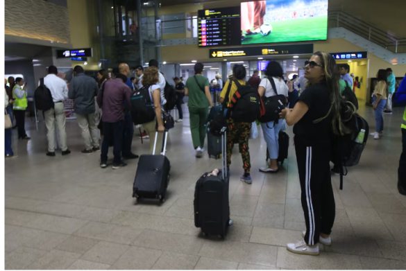
El Aeropuerto Internacional Rafael Núñez de Cartagena podría cerrar el 2024 con más de 7 millones de pasajeros movilizados.

Según datos de la Cámara Colombiana de Petróleo, Gas y Energía (Campetrol), compartidos por El Tiempo, con corte a junio de 2024, la demanda de los principales combustibles líquidos, incluyendo el Jet A1, alcanzó los 299.000 barriles por día, lo que representa una disminución en comparación con el año anterior. La demanda específica de Jet A1 se registró en 9.000 barriles por día, una caída del 41,6% en comparación con junio de 2023.