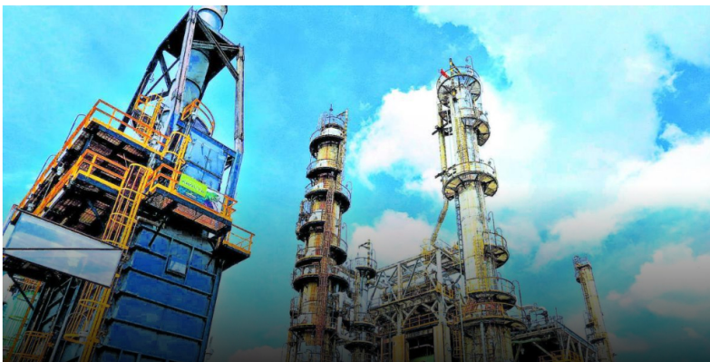
Ecopetrol es la empresa mayor en tamaño en Colombia. En la foto, la Refinería de Barrancabermeja.

De acuerdo con la empresa, la Refinería de Cartagena opera con normalidad y el fin de semana se entregaron a los 27.000 barriles de jet.