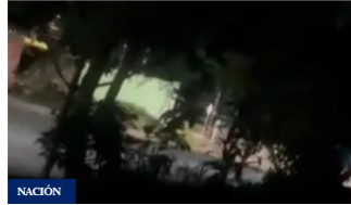
NACIÓN Reportan hostigamiento de la estación de Policía de Fortul, Arauca