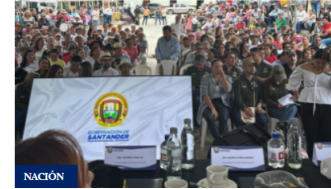
NACIÓN Inversión urgente en vías exigen alcaldes de Santander