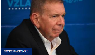
INTERNACIONAL González denuncia "citación sin garantías" por parte de la Fiscalía