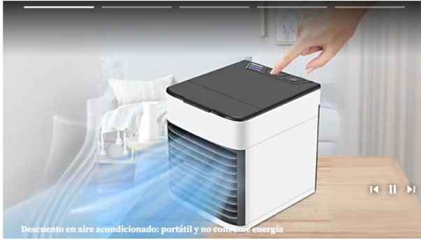
Descuento en aire acondicionado: portátil y no consume energía

Además: La Aerocivil habla de "reprogramar o cancelar vuelos" tras escasez de combustible para aviones en el país