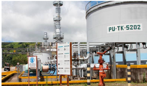
Durante este fin de semana se entregaron a los distribuidores mayoristas 64.100 barriles de gasolina, 108.500 barriles de diésel y 27.000 barriles de jet.

La petrolera indicó que la Refinería de Cartagena ya opera con normalidad, cumpliendo la entrega de combustibles.