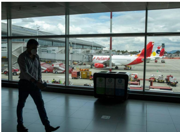
En aeropuertos clave, como Bogotá y Cartagena, varias aerolíneas podrían verse obligadas a suspender operaciones si no se encuentran soluciones inmediatas.

La situación, que afecta a varios aeropuertos del país, podría derivar en la cancelación de vuelos, con graves consecuencias para la conectividad aérea y el turismo.