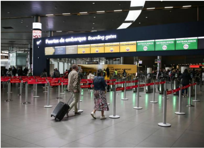
Desde inicios de la semana, Latam dijo que está ejecutando un plan de contingencia para gestionar los consumos de combustible y proteger el cumplimiento de sus itinerarios.

Los inventarios de combustible de aviación Jet A1 se agotaron en los aeropuertos de Leticia, Montería y Bucaramanga, mientras Bogotá se está reduciendo a niveles críticos.