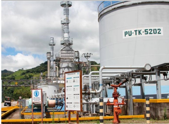
Seguir a @ContraReplicaMX

INICIO NACIÓN CIUDADES ACTIVO GLOBAL DEPORTES ENTORNOS OPINIÓN IMPRESO FRAGMENTOS TENDENCIAS