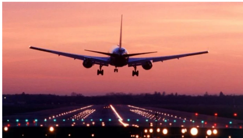
Combustible aviones.

La Asociación de Transporte Aéreo Internacional (IATA) anunció cuatro medidas que está adoptando con el fin de minimizar los impactos en el suministro de combustible de aviación .