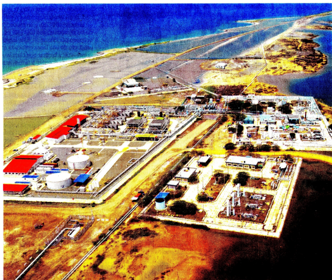
Siete de los ocho departamentos de la región, aportaron 399,51 millones de pies cúbicos, osea que la zona responde por el 27,9% de la producción nacional de gas.

En reservas probadas de gas, que son las que luego de unos análisis que hacen expertos se estiman que puede producir un pozo, la región