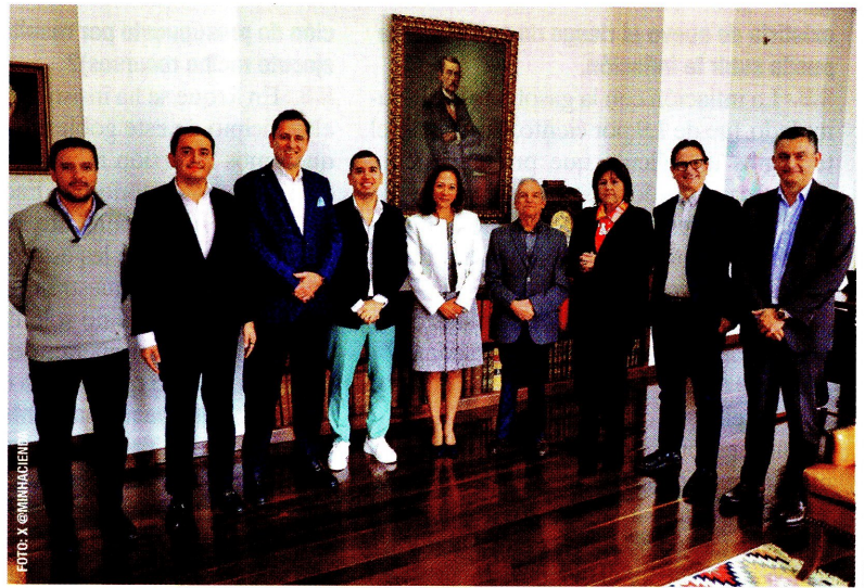
▲ Reunión entre banqueros y el Gobierno para crear un programa de créditos dirigidos a ciertos sectores, como la economía popular.

SEMANA: ¿Pero cree que con la reforma tributaria a la vista podríamos crecer? La Andi, por ejemplo, manifestó que las familias y las empresas no tienen más de dónde sacar para pagar impuestos.