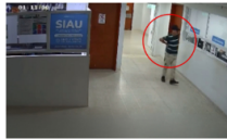
Creativo ladrón de celular quedó en video