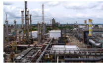
Reclaman a la USO convocatoria a huelga general