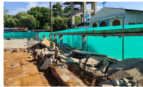
Ecopetrol invierte en escenarios deportivos de El Llanito