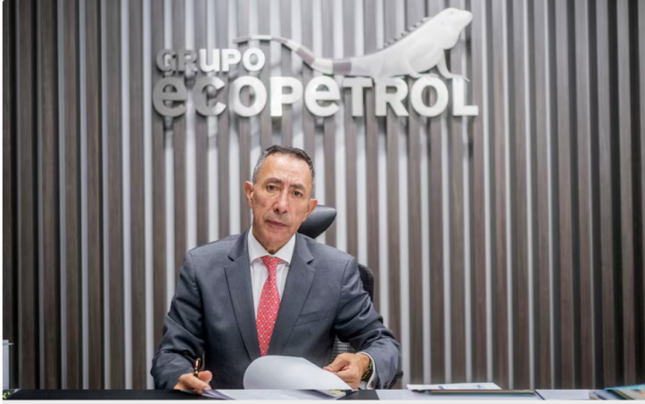
La Estrategia del Día: Movidas de la semana: Ecopetrol Cemargos, EPM, Isagen, Enel

Hoy hablaremos sobre las movidas empresariales con las que cierra esta semana: Ecopetrol, Cemargos, EPM, Isagen, Enel y más