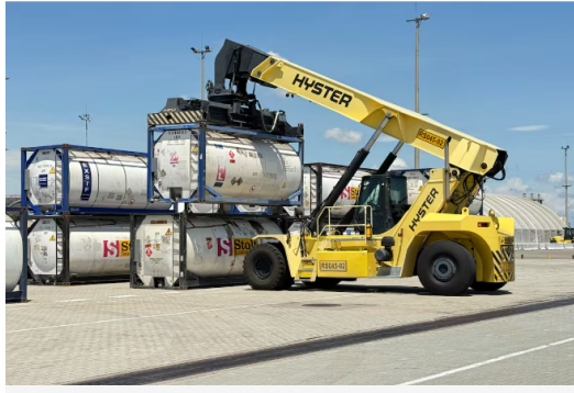
Este nuevo esquema disminuirá las emisiones a la atmósfera en cerca de 3 millones de toneladas de CO2 equivalentes por año.

Por primera vez, la empresa transporta sus productos directamente desde la refinería de Barrancabermeja hasta el puerto de destino, sin intermediarios